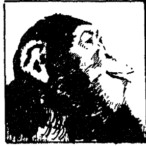
(شكل ٢) أثر الانفعال على الحيوان